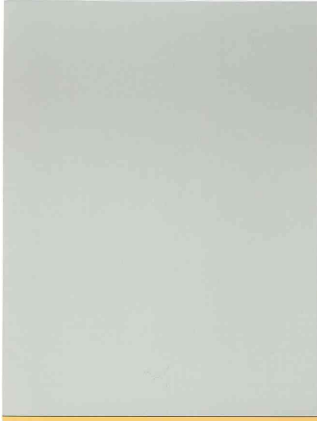
BLOC 6 COLONNES