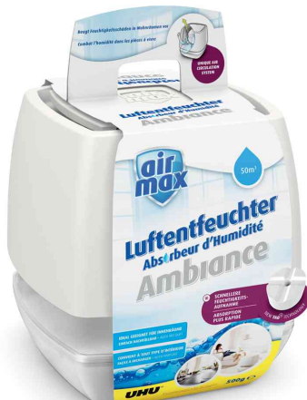
Luftentfeuchter Ambiance, weiß, 500 g