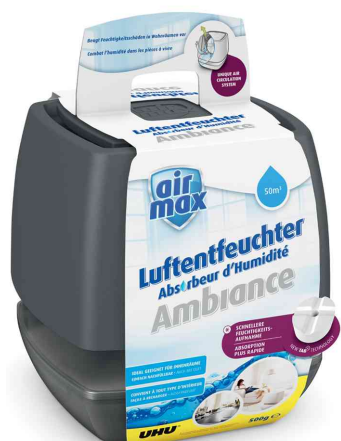
Luftentfeuchter Ambiance, anthrazit, 500 g

- ideal geeignet für den Einsatz in Wohnräumen, Schlaf- & Badezimmern, Toiletten etc.