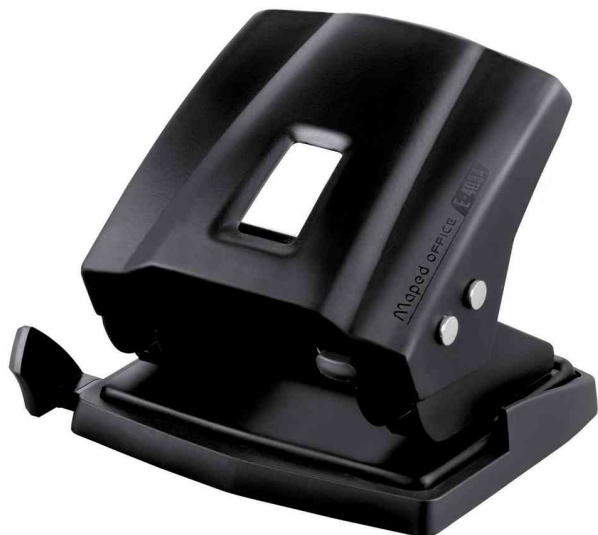
Locher Essentials E4034