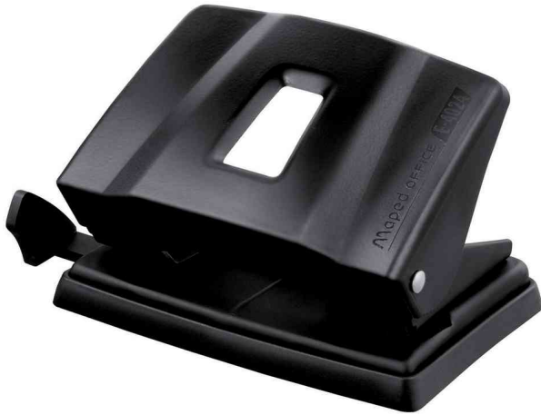
Locher Essentials E4024