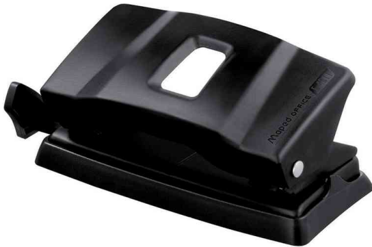
Locher Essentials E4011