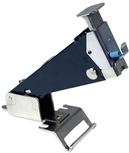
Elektro-Heftgerät Classic 106E