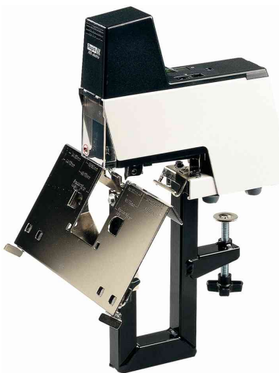
Elektro-Heftgerät Classic 106E mit Arbeitstisch