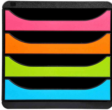
Schubladenbox BIG-BOX, mausgrau / harlekin