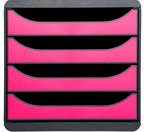
Schubladenbox BIG-BOX, mausgrau / himbeer