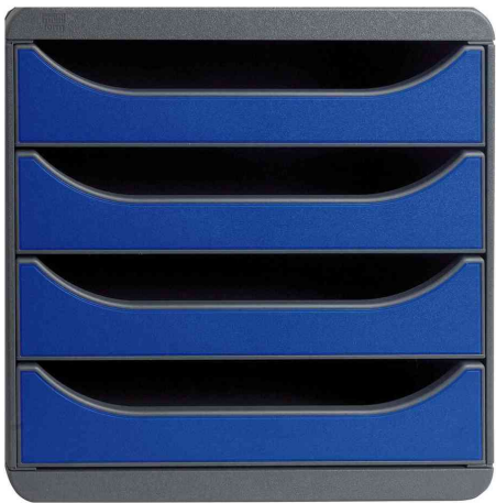
Schubladenbox BIG-BOX, mausgrau / königsblau