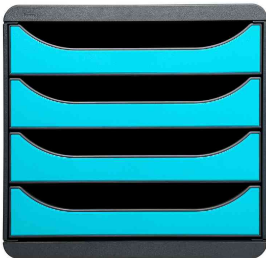
Schubladenbox BIG-BOX, mausgrau / türkis