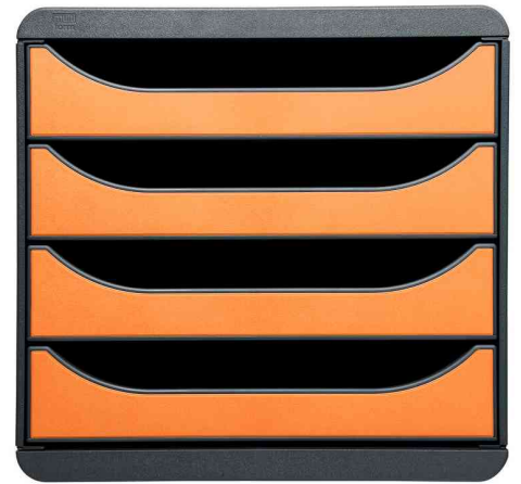
Schubladenbox BIG-BOX, mausgrau / mandarine