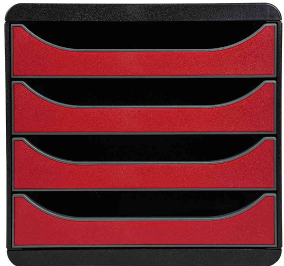
Schubladenbox BIG-BOX, schwarz / karminrot