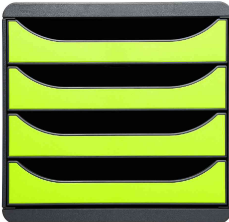
Schubladenbox BIG-BOX, mausgrau / lemongrün