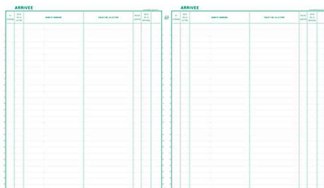
Registre "Enregistrement du courrier", grille