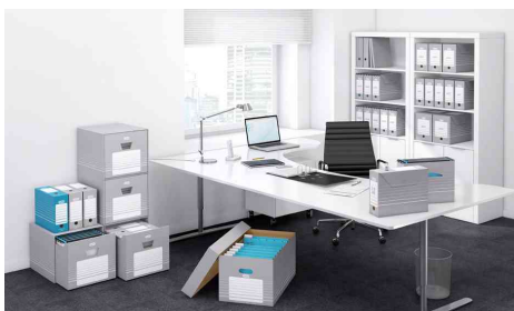
Zeigt die komplette Archivserie in Anwendung