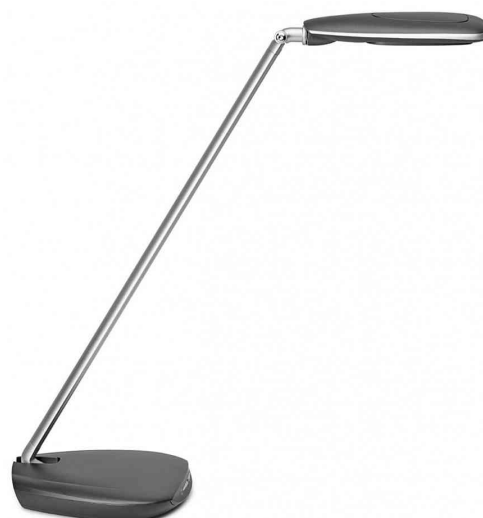
LED-Tischleuchte MAULpulse colour vario