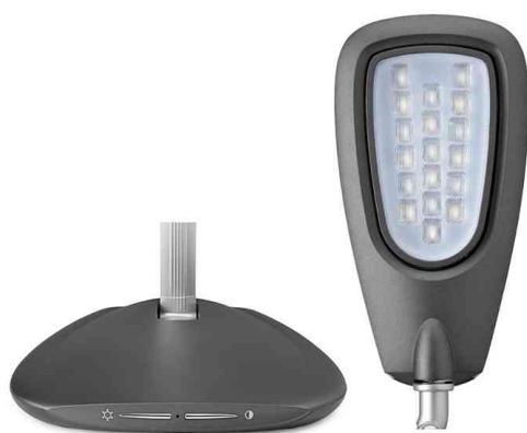
Detailbilder Bedienfeld / Leuchtenkopf