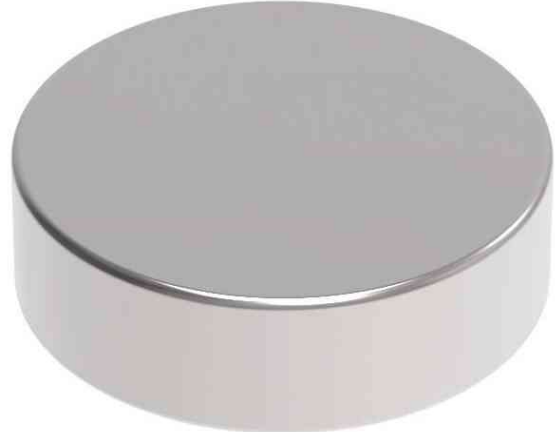
Neodym-Scheibenmagnet (Höhe: 3 mm)