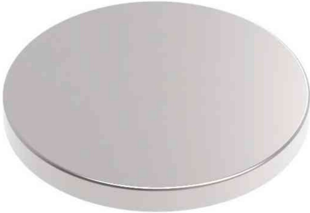
Neodym-Scheibenmagnet (Höhe: 1 mm)

- pur, elegant, modern: Für designorientierte Anwender, in repräsentativen Räumen, Agenturen, Museen