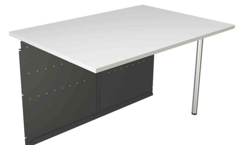
6) Symbolbild: Tischelement, 2-seitig gerade