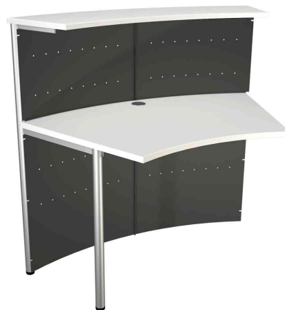
2) Symbolbild: Thekenelement, 2-seitig 45 Grad