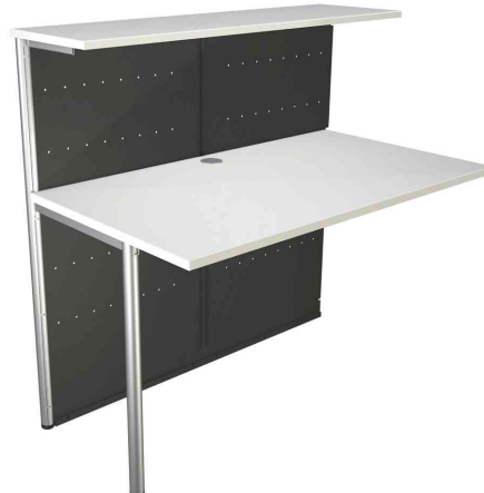
5) Symbolbild: Thekenelement, 2-seitig gerade