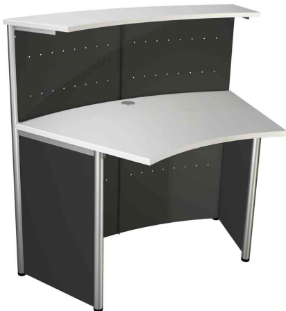
1) Symbolbild: Grundtheke, 2-seitig 45 Grad