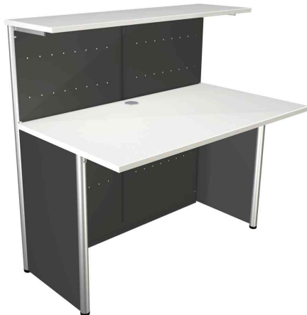
4) Symbolbild: Grundtheke, 2-seitig gerade