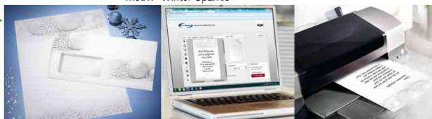
Am PC gestalten - Ausdrucken - Fertig!