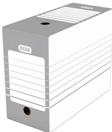
Archiv-Schachtel (B)150 mm