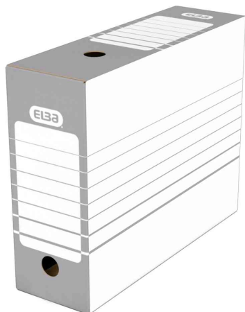
Archiv-Schachtel (B)100 mm