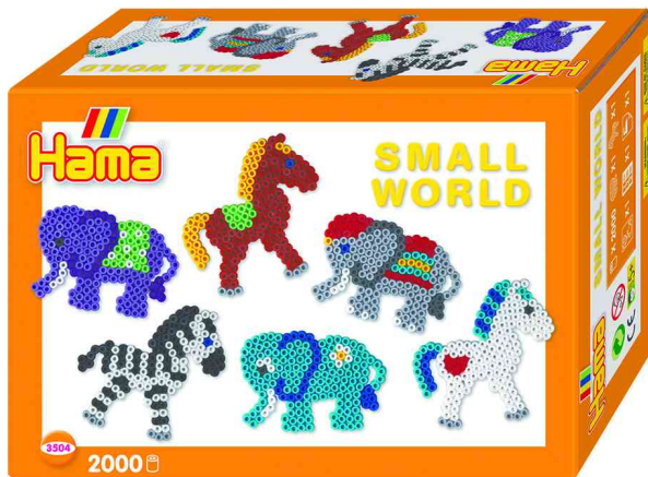
Bügelperlen midi "Small World Tiere"