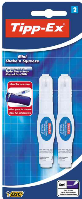
Korrekturstift "Mini Shake'n Squeeze", im 2er Blister