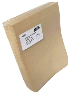
Symbolbid: Faltenversandtaschen fadenverstärkt