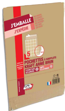
Symbolbid: Faltenversandtaschen fadenverstärkt