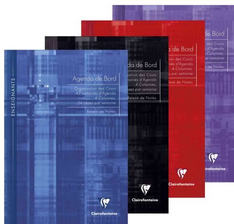
Visuel de référence: Agenda de bord pour enseignant