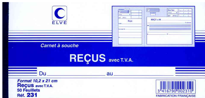
Carnet à souche "Reçu avec TVA"