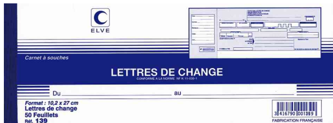
Carnet à souche "Lettres de change"