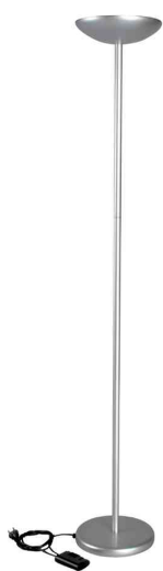
Halogen-Deckenfluter MAULsky, dimmbar