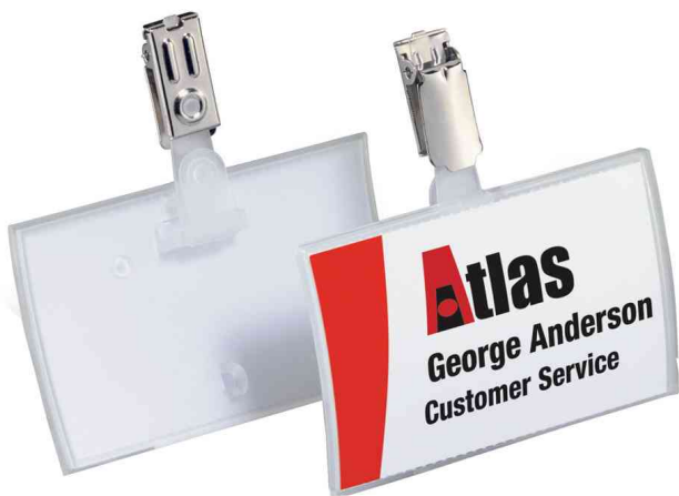
Namensschilder Click Fold, mit Clip