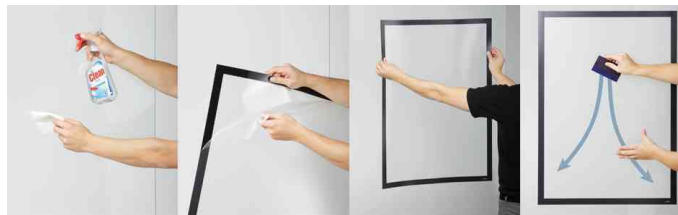
Einfache, blasenfreie Fixierung durch Adhäsion