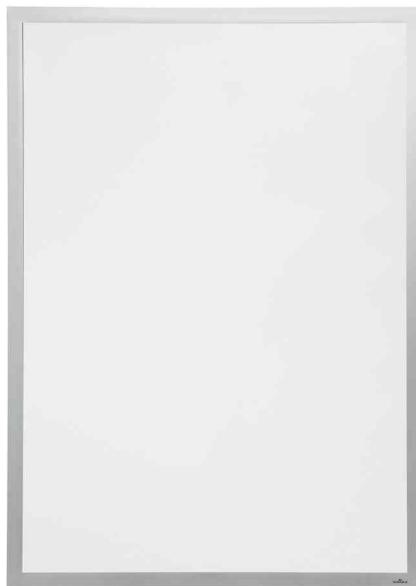
Plakaträhmen DURAFRAME POSTER, silber