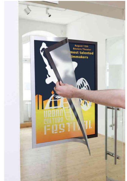
Leichtes Öffnen des Rahmens durch Magnete