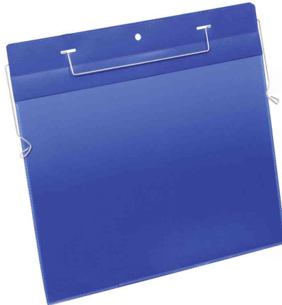
Drahtbügeltasche, DIN A4 quer