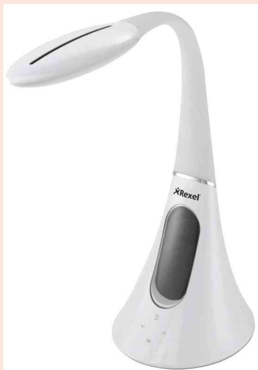
Tageslicht-Leuchte ActiVita Pod+