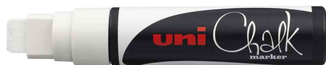
Kreidemarker Chalk PWE-17K, weiß