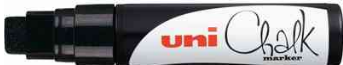
Kreidemarker Chalk PWE-17K, schwarz