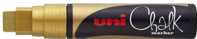
Kreidemarker Chalk PWE-17K, gold