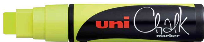
Kreidemarker Chalk PWE-17K, neongelb