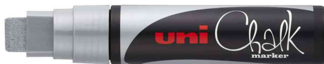
Kreidemarker Chalk PWE-17K, silber