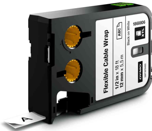
XTL Schriftband Nylon, Kassette