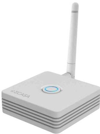
SmartHome Gateway / Basisstation "Casa Central"