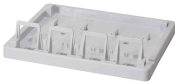
Keystone Aufputz-Leergehäuse, 4-fach, Detailansicht