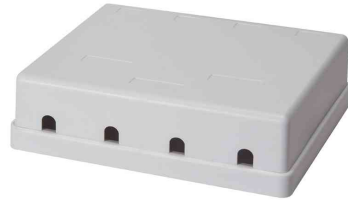
Keystone Aufputz-Leergehäuse, 4-fach, Rückansicht