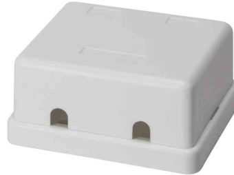
Keystone Aufputz-Leergehäuse, 2-fach, Rückansicht