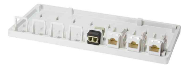
Keystone Aufputz-Leergehäuse, 8-fach, Anwendung