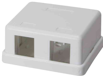
Keystone Aufputz-Leergehäuse, 2-fach

- schnelle und flexible Verkabelung im Netzwerk- oder Multimediabereich