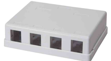
Keystone Aufputz-Leergehäuse, 4-fach