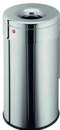
Wand-Papierkorb ProfiLine safe Wall XL, Edelstahl - silber