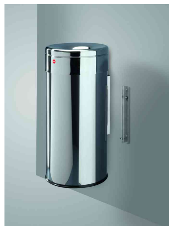
Wand-Papierkorb ProfiLine safe Wall XL, Edelstahl - silber, Wandmontage