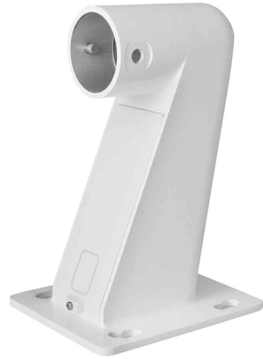
Zubehör: Kamera Wandhalterung (DN-16094-1)