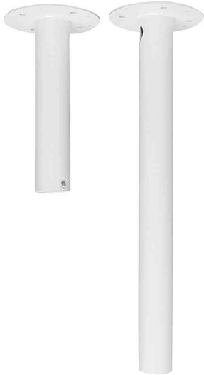
Zubehör: Kamera Befestigungsstange