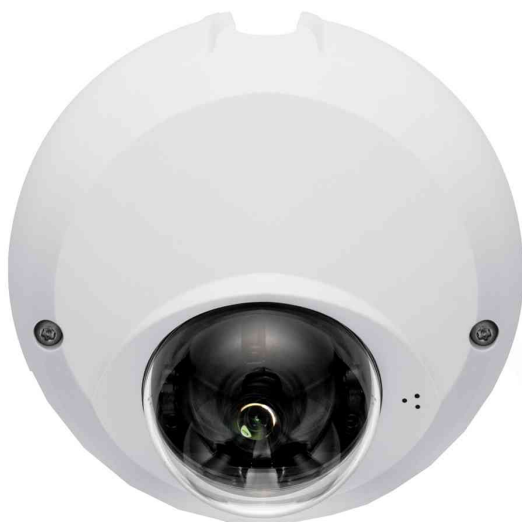
Mini IP Netzwerk Dome Kamera