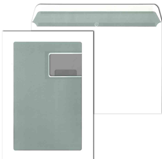
Schaufenster-Briefumschlag, C4 mit Adressfenster