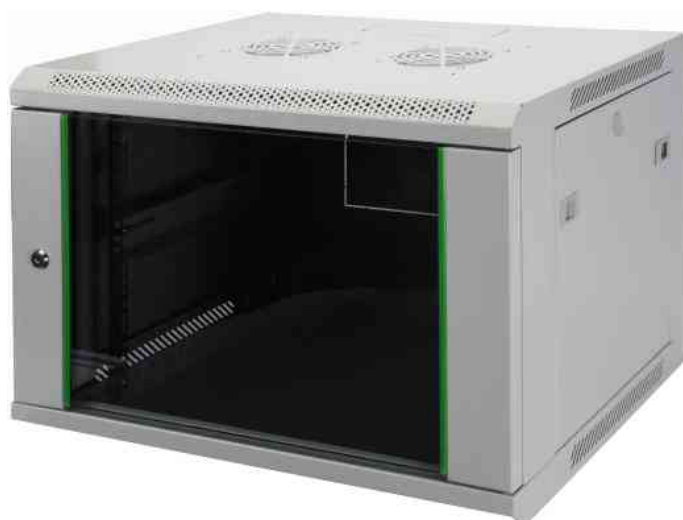
19" Wandverteiler Dynamic Basic