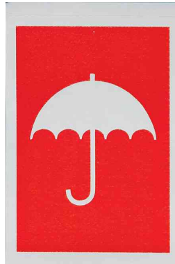
Hinweisetikett "Vor Nässe schützen"