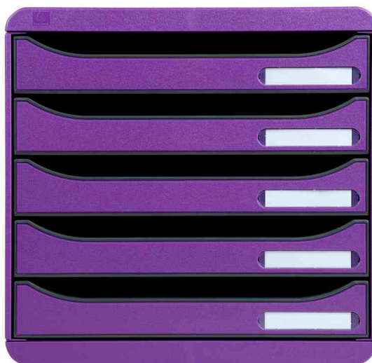
Schubladenbox BIG-BOX PLUS, violett