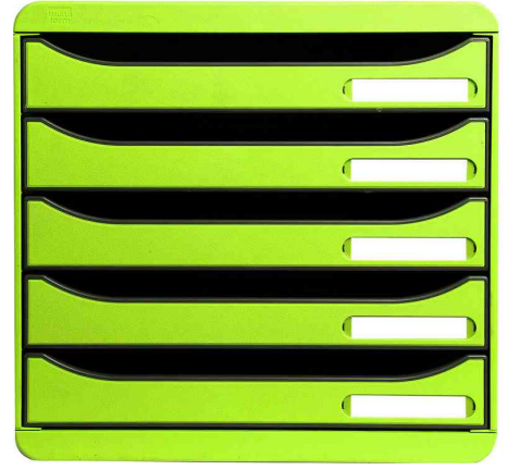
Schubladenbox BIG-BOX PLUS, lemongrün