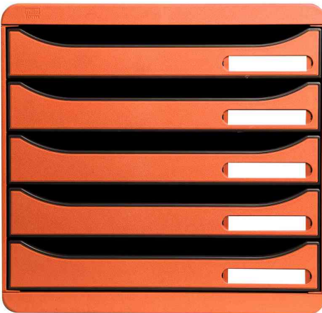
Schubladenbox BIG-BOX PLUS, mandarine