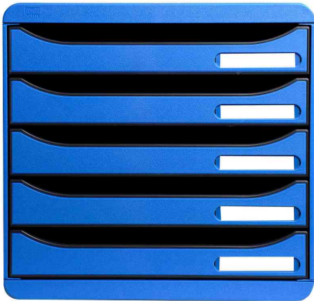
Schubladenbox BIG-BOX PLUS, eisblau

- für die Ablage von Dokumenten aller Art