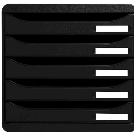
Schubladenbox BIG-BOX PLUS, schwarz