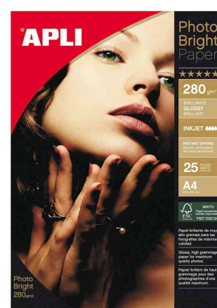
Foto-Papier, 280 g/qm