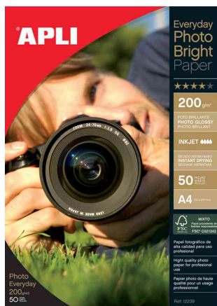
Foto-Papier, 200 g/qm

- für professionelle Ausdrücke von Fotos