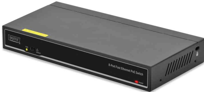
PoE Fast Ethernet Switch, 8 Port