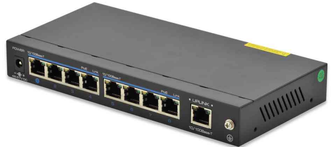
PoE Fast Ethernet Switch, 8 Port