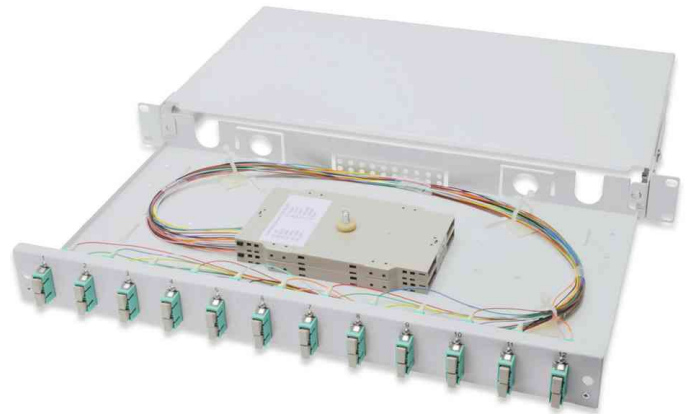
19" Glasfaser LWL Spleißbox, 12 x SC