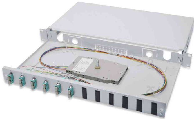
19" Glasfaser LWL Spleißbox, 6 x SC