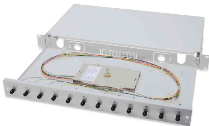
19" Glasfaser LWL Spleißbox, 12 x ST