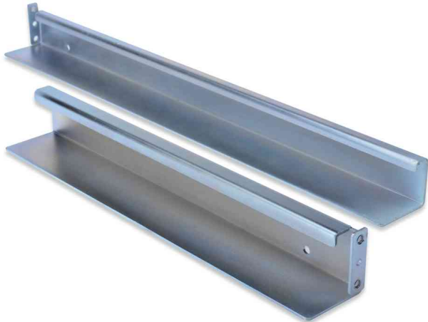
L-Support Gleitschienen-Set für Serverschränke