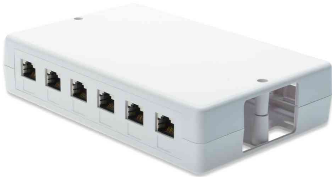
Aufputzbox für Keystone Module, 6-Port

- dient zum Aufbau von Konsolidierungspunkten an Schreibtischen, in Zwischendecken oder in Unterflursystemen