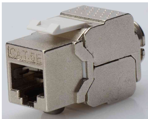
Keystone Modul Kat. 5e

- ermöglicht einfache und zeitsparende Installation in Verbindung mit exzellenten Messwerten, die auch anspruchsvollste Anwendungen wie 10/100 Base-T ermöglichen