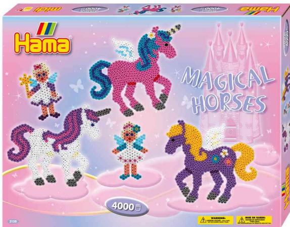
Bügelperlen midi "Zauberhafte Pferde", Geschenkpackung