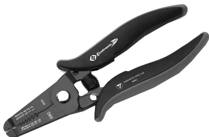
ESD Abisolierzange Ecotronic T3894

- zum sicheren und schonenden Abisolieren feiner, isolierter Leitungen mit festem Kern bei Anwendungen, bei denen Schäden durch elektrostatische Aufladung unbedingt zu vermeiden sind