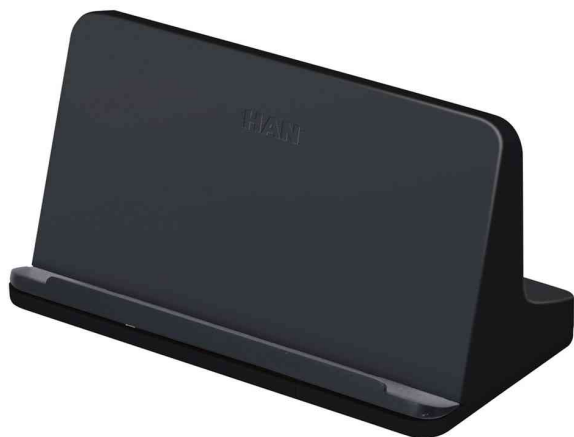
Tablet-PC-Ständer smart-Line, schwarz

Weitere Produkte aus der Serie smart-Line (Smartphone-Ständer, Stifteköcher, Schreibunterlage) finden Sie in unserem WebShop!