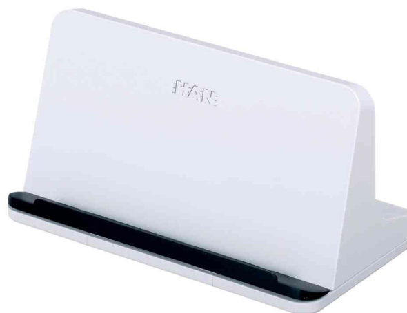
Tablet-PC-Ständer smart-Line, weiß