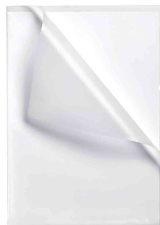
PREMIUM Sichthülle, transparent