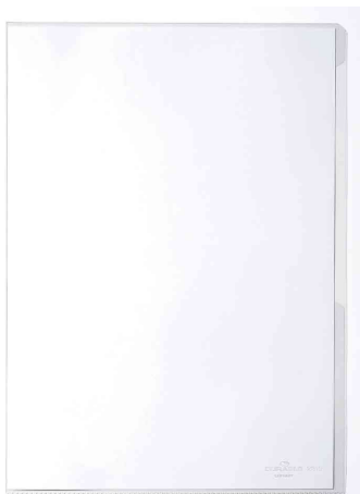
PREMIUM Sichthülle, glasklar