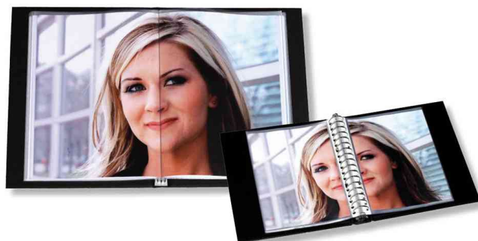
Vorteil: Blättern wie in einem Buch!