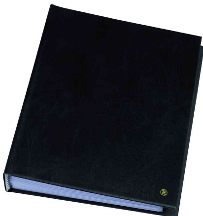
Sichtbuch "Original", DIN A5