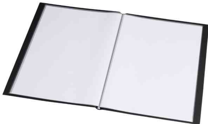
Sichtbuch "Original", DIN A4, offen