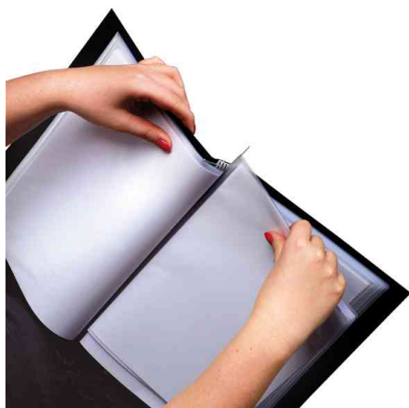
rillstab Mechanik: Einfacher Austausch der Hüllen